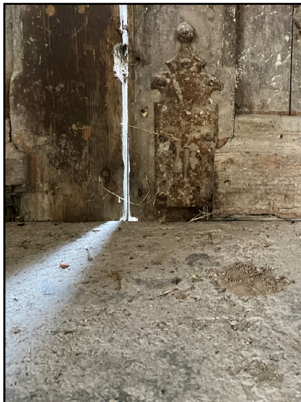
Istniejące dolne okucia drzwi – do zachowania i renowacji.