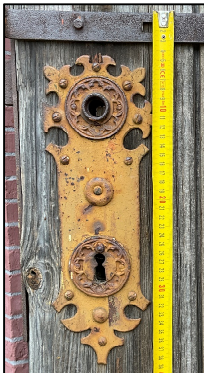
Istniejący stylizowany szyld – do zachowania i renowacji.