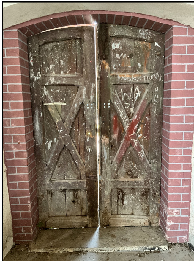
Istniejące drzwi wejściowe oznaczone symbolem D-01 – do zachowania i renowacji – widok od wewnątrz kościoła.

Projektuje się następujące prace związane z renowacją konstrukcji skrzydeł: