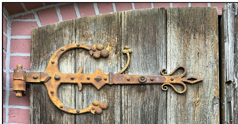
Istniejące stylizowane okucia – do zachowania i renowacji.