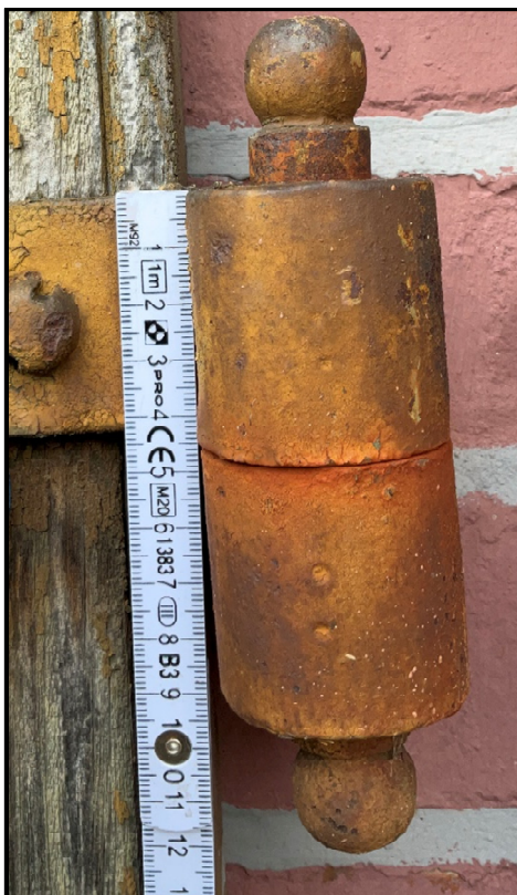
Istniejące zawiasy – do zachowania i renowacji.