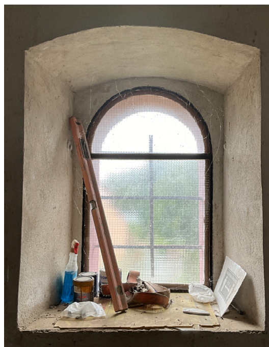
Istniejące okna w poziomie parteru przeznaczone do zamontowania parapetów kamiennych.