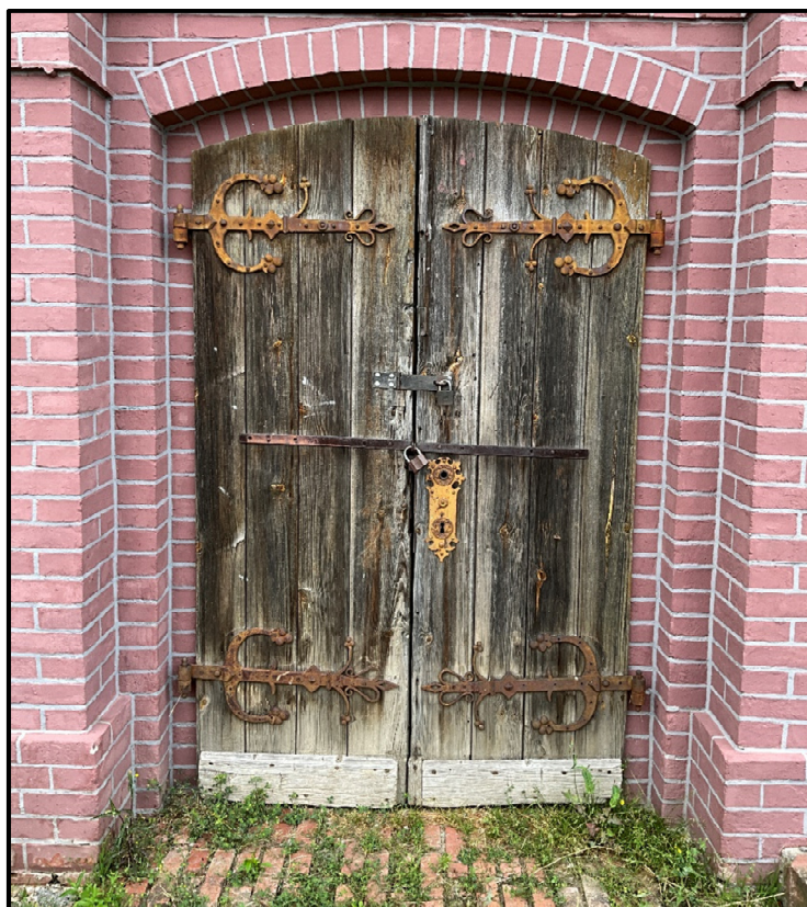
Istniejące drzwi wejściowe oznaczone symbolem D-01 – do zachowania i renowacji – widok od zewnątrz kościoła.

Należy zachować istniejące okucia, zawiasy i sposób montażu skrzydeł drzwiowych do ościeży. Wszystkie elementy należy delikatnie zdemontować, następnie oczyścić mechanicznie poprzez piaskowanie lub chemicznie z wszystkich istniejących nawarstwień farb i występującej korozji. Po oczyszczeniu, elementy poddać procesowi ocynkowania a następnie pomalować proszkowo w kolorze brązowym. Okucia montować z zastosowaniem nowych łączników - ozdobnych nitów i gwoździ. Elementy mechaniczne zamku odrestaurować i zastosować ponownie w nowej obudowie. Skrzydło drzwiowe należy doposażyć w nową stylizowaną klamkę. Wzór klamki uzgodnić ostatecznie, na etapie zamawiania i montażu, z konserwatorem zabytków. Drzwi wyposażyć w próg z kamienia naturalnego gr. 4 cm, płomieniowanego. Poniżej przedstawiono elementy przeznaczone do odrestaurowania i zachowania.