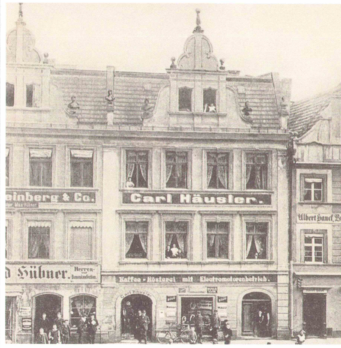
Fot. nr 4 – Elewacja frontowa – zdjęcie archiwalne.