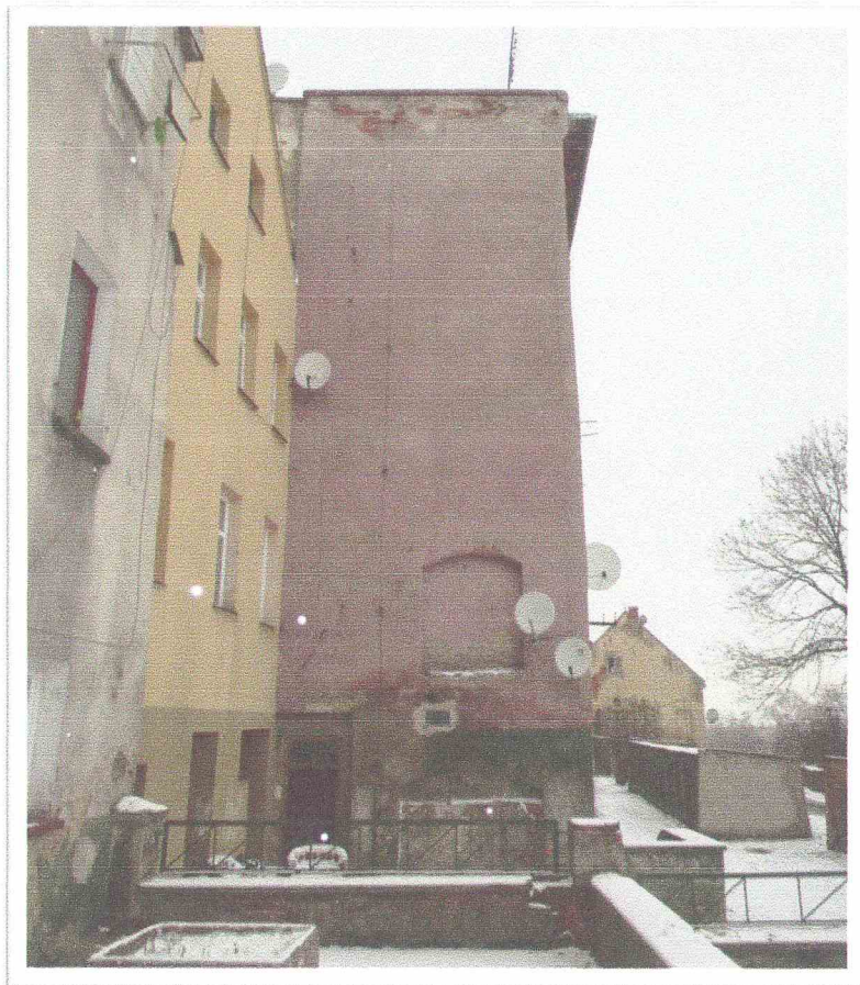
Fot. nr 2 – Elewacja szczytowa – część - stan istniejący.