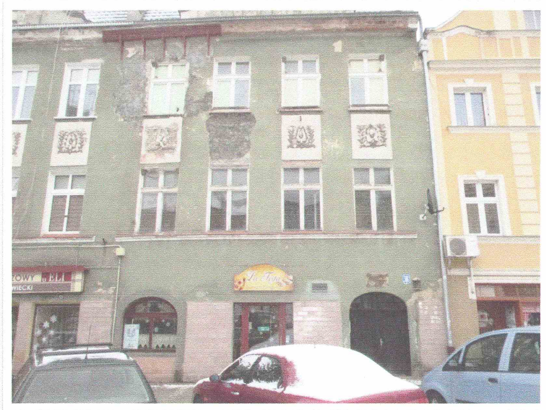
Fot. nr 1 – Elewacja frontowa – stan istniejący.