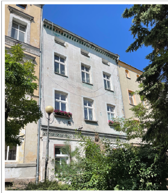
Fot. Nr 1 - Elewacja frontowa - stan istniejący.