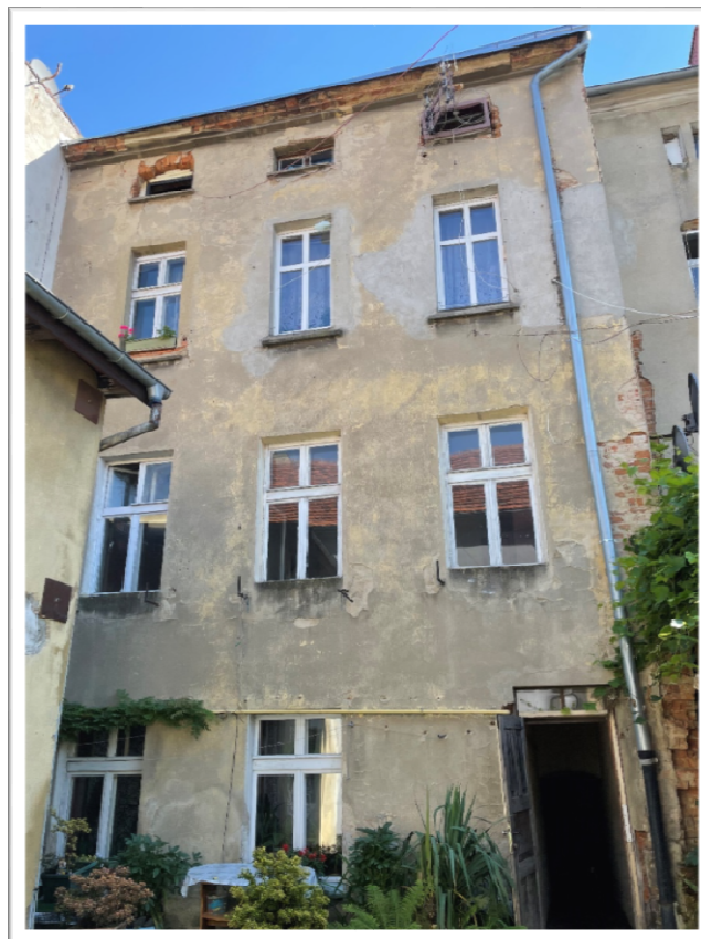
Fot. Nr 2 - Elewacja tylna - stan istniejący.